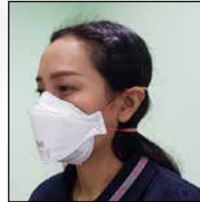
ภาพที่ ๖.๔ หน้ากาก N๙๕