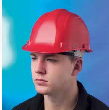
ภาพที่ ๖.๑ อุปกรณ์ปกป้องศีรษะ

เป็นอุปกรณ์สำหรับป้องกันอันตรายจากการกระแทก การเจาะทะลุของวัตถุที่มากกระทบศีรษะหรืออันตรายจากไฟฟ้า ทำจากวัสดุที่แข็ง เหนียว และทนทาน