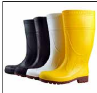
ภาพที่ ๖.๙ อุปกรณ์ปกป้องเท้า