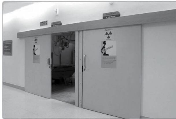
ภาพที่ ๒.๒ ตัวอย่างรังสีที่ก่อให้เกิดการแตกตัว ห้องเอกซเรย์

รังสีที่ก่อให้เกิดการแตกตัวได้ถูกนำมาใช้ในโรงพยาบาลในรูปแบบที่แตกต่างกัน เช่น รังสีเอกซ์ หรือรังสีแกมมา ทั้งนี้ขึ้นอยู่กับวัตถุประสงค์ของการนำมาใช้งาน ได้แก่ การวินิจฉัยโรค การรักษาโรคต่าง ๆ การเตรียมยาและผลิตยา