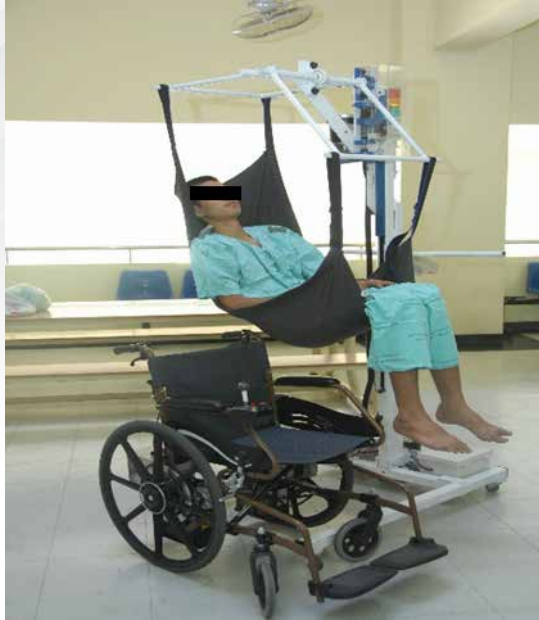
ภาพที่ ๓.๒. ตัวอย่างอุปกรณ์ช่วยยกผู้ป่วย

ที่มา : http://www.news.rmutt.ac.th/wp-content/uploads/๒๐๑๑/๐๕/DSC_๐๐๕๕.jpg