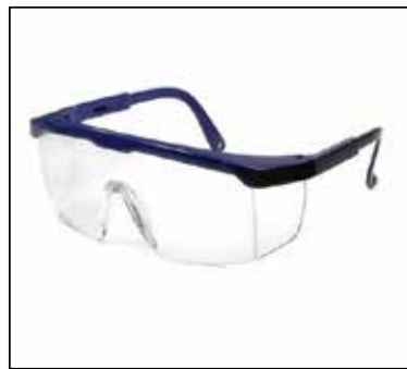
ภาพที่ ๖.๒ อุปกรณ์ปกป้องใบหน้าและดวงตา