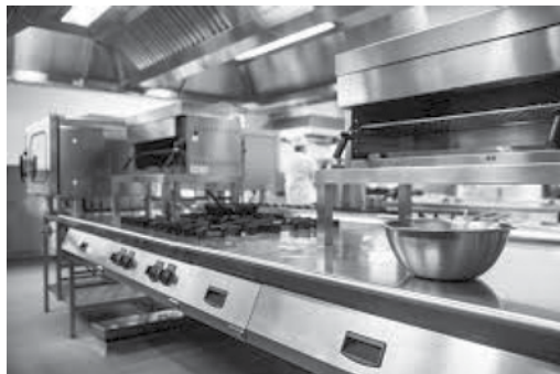
ภาพที่ ๒.๑ ตัวอย่างแหล่งกำเนิดความร้อนในแผนกโภชนาการ

๑) แผนกที่พบ เช่น โรงซักฟอก ห้องติดตั้งหม้อไอน้ำ งานโภชนาการ แผนกซักฟอก ฯลฯ