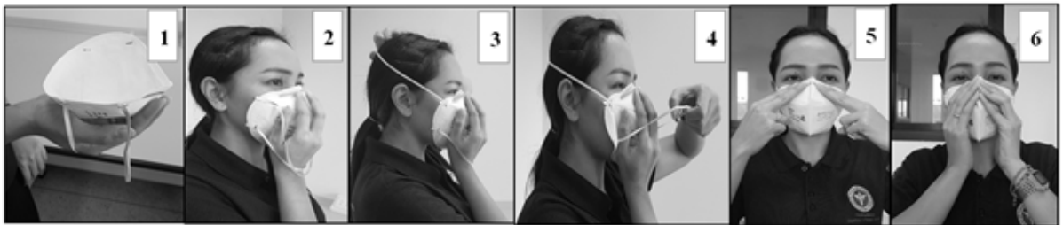
ภาพที่ ๖.๕ ตัวอย่างขั้นตอนการทำ Seal check ก่อนการใช้งานหน้ากากชนิด N๙๕ แต่ละครั้ง

(๒) ถ้ามีอากาศรั่วไหลออกทางขอบหน้ากากลมให้รัดแถบอลูมิเนียม ปรับตำแหน่งของหน้ากาก ใหม่ หรือดึงสายรัดไปด้านหลังมากขึ้น จากนั้นตรวจสอบความแนบสนิทใหม่อีกครั้ง