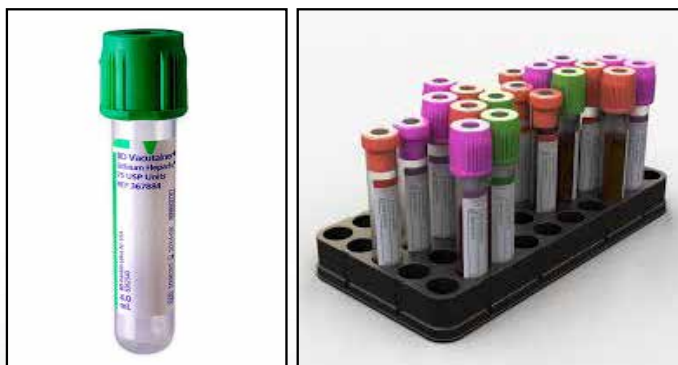
ภาพที่ ๔.๑ Vacutainer tube

๙) กรณีไม่สามารถนำส่งห้องปฏิบัติการได้ในทันที ให้เก็บรักษาตัวอย่างไว้ในตู้เย็นที่อุณหภูมิ ๒-๘ องศาเซลเซียส โดยอุณหภูมิประมาณ ๔ องศาเซลเซียส ซึ่งเป็นอุณหภูมิที่เหมาะสม ทำให้เลือดไม่เสื่อมสภาพ (ไม่เก็บรักษาตัวอย่างเลือดในช่องแช่แข็งหรืออุณหภูมิสำหรับแช่แข็ง)