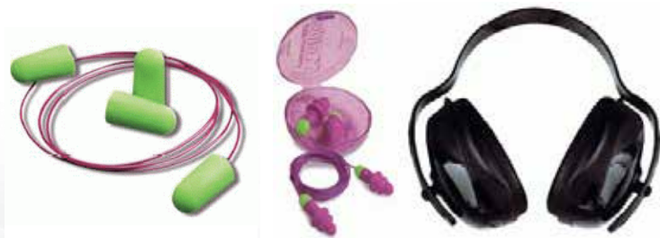
ภาพที่ ๖.๖ Ear plugs และ Ear muff

๑) ที่อุดหู (ear plugs) เป็นอุปกรณ์ที่สอดไว้ในช่องหูเพื่อกันทางเดินเสียงและดูดซับเสียง ลดเสียง ได้ตั้งแต่ ๑๕-๒๕ dB ลดเสียงที่มีความถี่ต่ำกว่า ๔๐๐ Hz ได้ดี มักทำจากยางสังเคราะห์ที่อ่อนนุ่มหรือโฟม จึงสวมใส่ได้โดยไม่รู้สึกเจ็บในช่องหู สิ่งที่ควรระวัง คือ ไม่ควรใช้ที่อุดหู หากภายในช่องหูมีบาดแผล ผู้ใช้ควรฝึกการสวมใส่ให้ถูกต้องเพื่อให้ได้ประสิทธิภาพในการลดเสียงอย่างเต็มที่