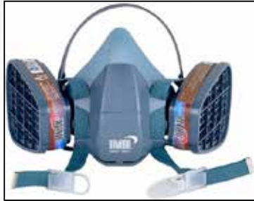
ภาพที่ ๖.๓ หน้ากากชนิดมีไส้กรองก๊าซและโอโรเซเหย

หน้ากากกรองอนุภาคตามมาตรฐานของประเทศสหรัฐอเมริกา จะยึดเกณฑ์ตามมาตรฐาน ๔๒CFR Part ๘๔ ซึ่งตามมาตรฐานนี้ หน้ากากกรองอนุภาคที่ผ่านมาตรฐานจะได้รับการรับรองจาก NIOSH และ Department of Health and Human Services : DHHS ซึ่งสามารถแบ่งได้เป็น ๙ ประเภทด้วยกัน โดยจะแบ่งตามประสิทธิภาพการกรอง (๙๕% ๙๙% และ ๙๙.๙๗%) และชนิดของไส้กรอง (N, R and P) ซึ่งทั้งหมดใช้อนุภาคขนาดเดียวกัน คือ ๐.๓ micrometers