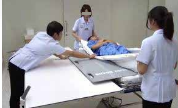
ภาพที่ ๒.๔ ตัวอย่างท่าทางการทำงานที่ผิดปกติ หรือฝืนธรรมชาติจากการเคลื่อนย้ายผู้ป่วย

เวลานาน จะทำให้เกิดความผิดปกติของกล้ามเนื้อและกระดูกโครงร่าง (Musculoskeletal Disorders : MSDs) ซึ่งหมายถึง อาการเจ็บปวดถาวร และมีความเสื่อมของกล้ามเนื้อ รวมถึงข้อต่อ เอ็น และเนื้อเยื่ออื่น ๆ ที่อยู่ใกล้เคียง ตัวอย่างเช่น โรคปวดหลังส่วนบนเอว (low back pain) เอ็นอักเสบ (tendinitis) เอ็นและปลอกหุ้มอักเสบ (tenosynovitis) กลุ่มอาการอุโมงค์คาร์ปาล (Carpal Tunnel Syndrome : CTS) เป็นต้น นอกจากจะเกิดความผิดปกติของกล้ามเนื้อและกระดูกโครงร่างแล้วยังก่อให้เกิดความล้าจากการทำงาน และความเครียดจากการทำงานด้วย