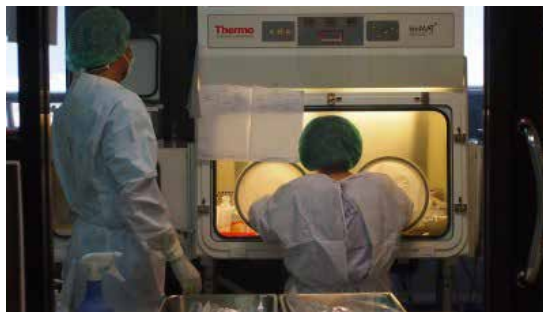
ภาพที่ ๒.๓ การทำงานกับสารเคมีในห้องผสมยาเคมีบำบัด

๒.๓.๑ แผนกที่พบ สามารถพบได้เกือบทุกแผนก เช่น ห้องปฏิบัติการ ห้องผสมยา ห้องเคมีบำบัด แผนกซักฟอก ซ่อมบำรุง และแผนกอื่น ๆ ที่มีการใช้สารเคมีในขั้นตอนการทำงานต่าง ๆ