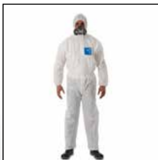
ภาพที่ ๖.๘ อุปกรณ์ปกป้องลำตัว

ใช้สำหรับป้องกันไม่ให้ผิวหนังของร่างกายได้รับอันตรายจากสารเคมี ทั้งจากการดูดซึมผ่านและการเกิดปฏิกิริยาเฉพาะที่ เช่น ไหม้ บวม คัน เป็นแผล เป็นต้น